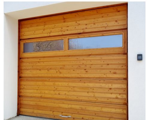
Holz-Sektionaltor mit Fenstersektion