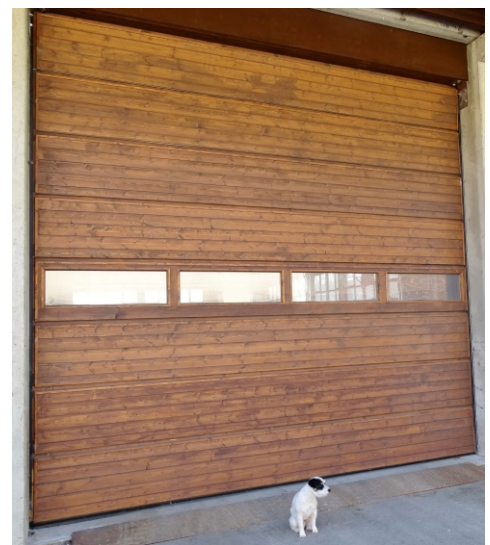
Holz-Sektionaltor in Lagerhalle, 4,7 x 4 m