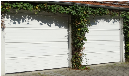
Holz-Sektionaltor RAL 9016 verkehrsweiss