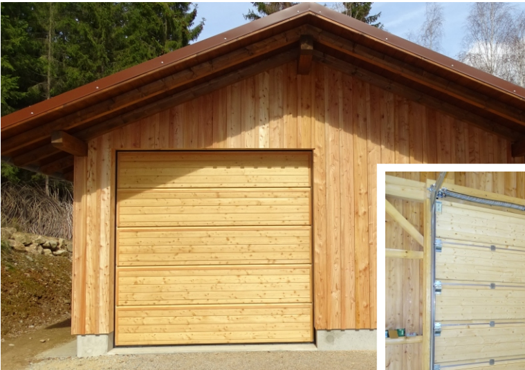
Holz-Sektionaltor, außen Lärche-Profilbretter innen Fichte-Profilbretter